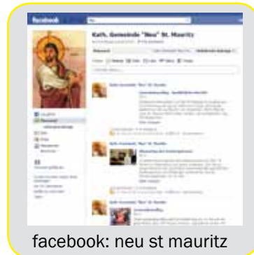
facebook: neu st mauritz